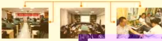
CHAWNING / 13